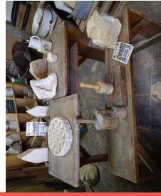
Steindruck auf Stoffen (Draußen neben dem KTF)