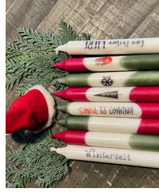
Kerzen gestalten (im StadtHaus oben)