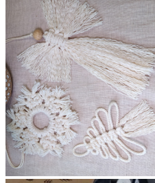
Makramee- Anhänger (im StadtHaus unten)